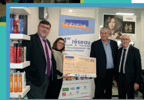
Evénements presse chez nos bénéficiaires