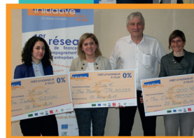
Remises de Fonds Collectives