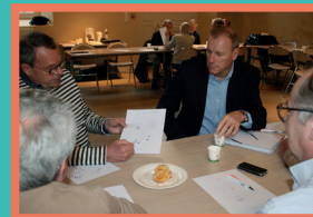
Rencontre du Club des Parrains et Marraines