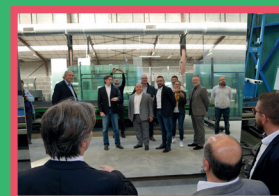
Conférence de presse chez Mouton Esmard