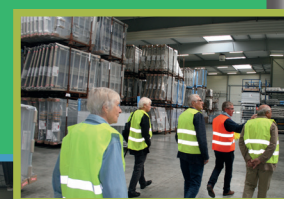
Rencontre du Club des Parrains et Mairaines chez MTS